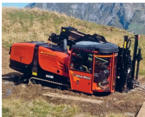
Spülbohrtechnik im Einsatz.

Stemba AG aus Bronschhofen SG brilliert in gesteuerter Spülbohrtechnik. Als 30. TopBetrieb-Zertifikatsträger setzt das Unternehmen neue Massstäbe im nachhaltigen Handwerk. Die Stemba AG definiert nicht nur die Zukunft des Tiefbaus, sondern auch Standards für verantwortungsvolles Handeln. Mit GPS-vermessenen Bohrungen und dem angesehenen TopBetrieb-Zertifikat beweisen sie, dass nachhaltiges Handwerk nicht nur möglich, sondern auch die Zukunft ist. Mit massgeschneiderten Lösungen bieten sie zudem Effizienz und Umweltfreundlichkeit aus einer Hand. Entdecken Sie die Zukunft des Tiefbaus auf www.stemba.ch .